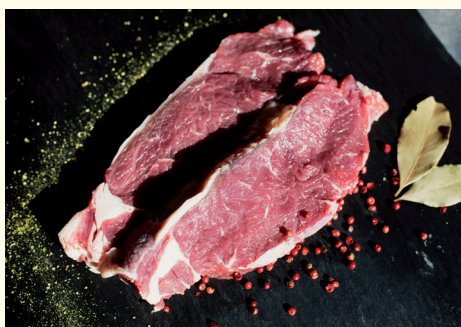
Bild: Der Genuss von regionalem Bio-Weidefleisch entsteht durch die äußerst hohe Fleischqualität, sowie durch das Wissen um die respektvolle Tierhaltung, die kurzen Transportwege und die positiven Umwelteffekte der Bio-Landwirtschaft.

Verkaufswagen ist auf Märkten der Öko-Modellregion unterwegs und versorgt bewusste Verbraucher*innen mit hochwertigem Fleisch von Weiderindern aus der Öko-Modellregion ( www.bergbauernwagal.de ). „Wir arbeiten derzeit auch an einer Online-Verkaufsplattform für bestes Bio-Rindfleisch aus der Öko-Modellregion. Auf dieser Plattform können Verbraucher*innen Betriebe in ihrer Nähe finden, die Bio-Rindfleisch anbieten. Sie können das Fleisch bequem online bestellen und es dann entweder direkt ab Hof abholen, oder es sich nach Hause schicken lassen.“ so Adeili. Ziel der Öko-Modellregion ist, den regionalen Bio-Rindfleisch-Konsum anzuheben. „Wir wünschen uns für die Zukunft, dass sich Verbraucher*innen bewusst für regionales Bio-Rindfleisch entscheiden und dessen Vorzüge und Hintergrund kennen. Denn bei der Erzeugung von Bio-Milch entsteht automatisch auch hochwertiges Bio-Rindfleisch. Die Milcherzeugung und die Rinderhaltung sind die wirtschaftlich bedeutendsten Einkommenszweige unserer Landwirte. Weide- und Almflächen können dabei sehr effizient von Kühen beweidet und gepflegt werden - ein großer Beitrag zum Erhalt der Kulturlandschaft und der Biodiversität“, so die Projektmanagerinnen.